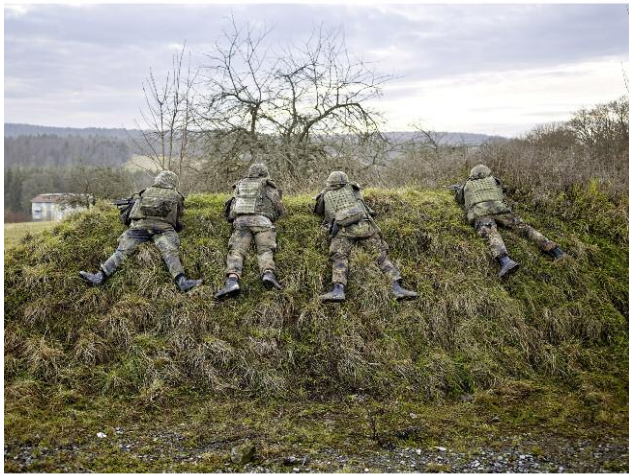
Hammelburg, Deutschland, 2009