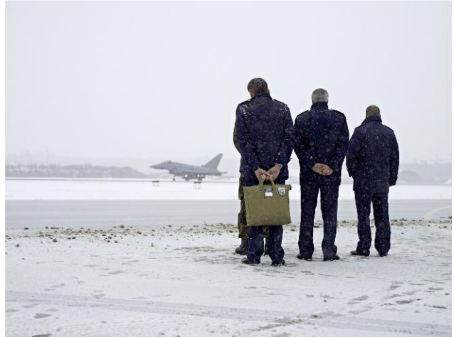
Neuburg, Deutschland, 2010