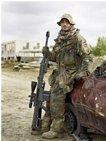
Lehnin, Deutschland, 2009