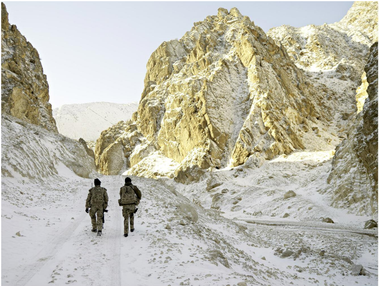
Masar Sharif, Afghanistan, 2010