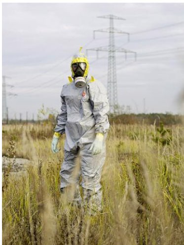
Werdeck, Deutschland, 2009