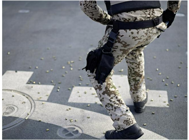
Golf von Aden, Auf See, 2009