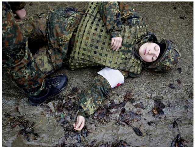
Hammelburg, Deutschland, 2009