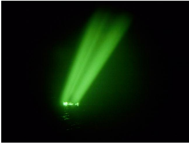
Golf von Aden, Auf See, 2009